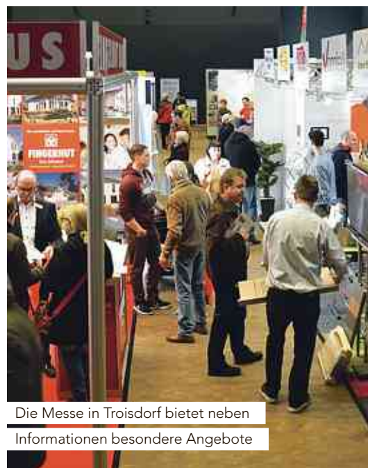
Die Messe in Troisdorf bietet neben Informationen besondere Angebote

RENOMMIERTE AUSSTELLER. Ob Immobilienbesitzer oder Mieter – die „Bau- und Wohnträume“ steckt voller Informationen rund ums Bauen und Wohnen. In der Stadthalle halten renommierte Aussteller Produkte, anschauliche Präsentationen und individuelle Beratun-