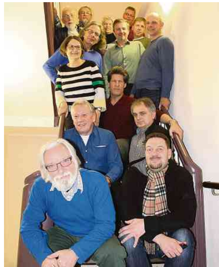
Die Fotofreunde Much treffen sich seit 2009, um sich über ihr Hobby auszutauschen, und unternehmen gemeinsame Touren.

Wer Interesse am Mitmachen hat, kann sich am jeweils zweiten Montag im Monat um 19 Uhr im Klostersaal einfinden. www.fotofreunde-much.de