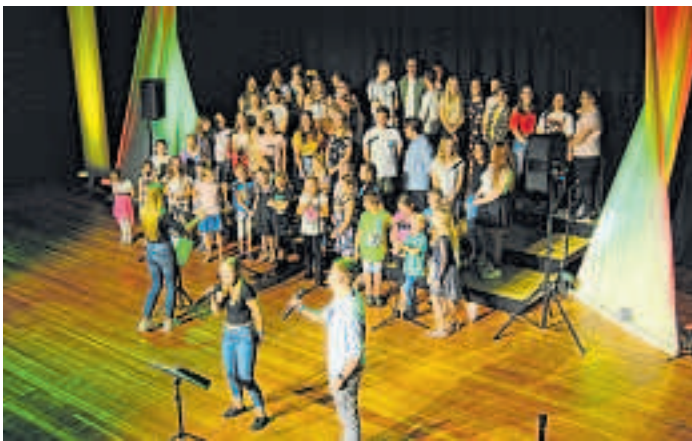
Der Chor Friends of Music aus Oberauessem begeisterte das Publikum im Bergheimer Medio mit dem Konzert „So klingt der Sommer“.

Tanzaufführungen ebenfalls für gute Stimmung und wurden dafür auch mit viel Applaus belohnt.